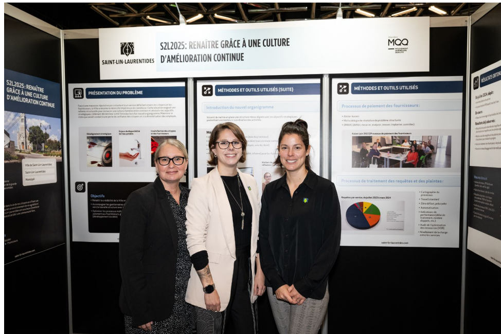
Kiosques standards, 10 pi x 10 pi, 5 panneaux